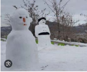
كوردییدییا - شۆره بەفرینه