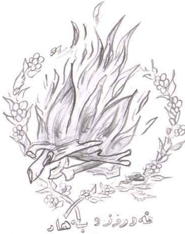
وئتە دەسكردەكانى نەورۇزنامە لە كارە ھونەرپىيەكانى ھونەرمەند (مژەقەر نامدارى) يە.