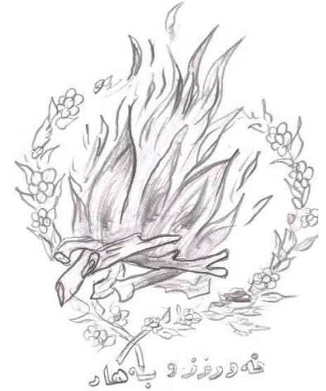
وێنە دەسکردهکانی نەورۆزنامە ئە کارە ھونەرپێھکانی ھونەرمنەند (مژەفەر نامداری)یە.

Emirro rojê pîroze emiro, cejinî newroze newroz seretayi salle werizekeyşî behare