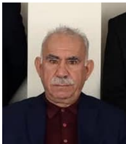
تصویر جدید آپو

سری ثریا اوندر پس از بیانیه صحبت کرد و بیان داشت که عبدالله اوجالان به هیئت‌نچین گفت: «بی‌گمان برای این که سلاح‌ها در عمل بر زمین گذاشته شود و پ‌ک‌ک خود را منحل کند باید بعد سیاست دموکراتیک و حقوقی به رسمیت شناخته شود.»